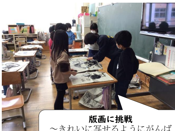
版画に挑戦 ～きれいに写せるようにがんばっています。～