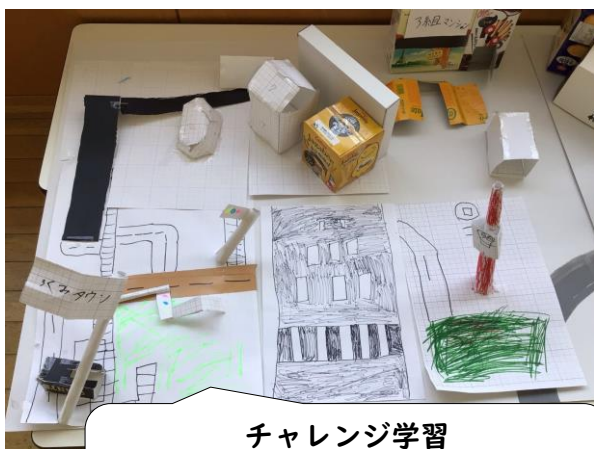
チャレンジ学習 ～作った箱を使って東京のような街にしたいな。～

マイプラン学習では、チャレンジ学習で作った箱で街を作ったり、漢字クイズに取り組んだりしています。国語の学習では、「楽しかったよ、二年生」で今年度の行事や学習の中で心に残っていることを書いて、発表することに取り組んでいます。図工の学習では、紙版画に取り組んでいます。紙にきれいに写せるように紙版の大きさや形を工夫したり、インクのつけ方に気をつけたりしています。休み時間には、なわとびをしている子がたくさんいます。たくさん練習して、できる技が増えてきています。