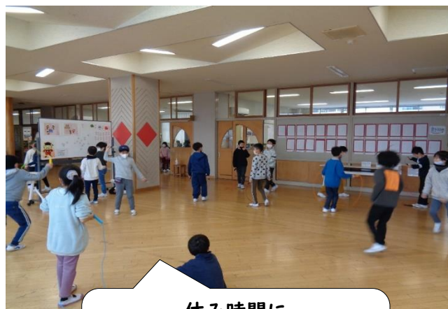
休み時間に ～いろいろな技を練習しています。～